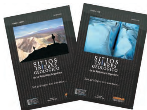
Figura 9 – Sitios de Interés Geológico de la República Argentina. Volumen I (Norte) y Volumen II (Sur).

Las conexiones entre geología y antropología, así como referencias históricas sobre la actividad minera y las exploraciones e investigaciones científicas pioneras, enriquecen algunos de los capítulos, además de menciones especiales sobre flora y fauna. Al especial interés geológico de la gran mayoría de los SIG escogidos, se contempló la accesibilidad, buen estado de preservación y gran belleza y expresividad escénica. Los volúmenes están escritos en idioma español y cada sitio cuenta con un breve resumen introductorio en inglés. La obra tiene el propósito de difundir el conocimiento geológico, contribuir a la transmisión del pensamiento científico y estimular actividades educativas, y de esta manera promover la protección del patrimonio (Miranda & grupo CSIGA, 2009, 2010; Echeverría et al. 2010).