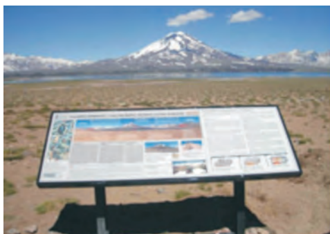
Figura 11 – Paneles temáticos instalados en el marco del proyecto Sitios de Interés Geológico del SEGEMAR. Reserva Natural Laguna del Diamante, provincia de Mendoza.

Trabajos de esta índole se han realizado en la Reserva Natural Urbana General San Martín en la provincia de Córdoba (Gaido et al. 2010); en La Reserva Natural Urbana Parque del Este, Baradero y en diferentes áreas de San Pedro, ambas localidades de la provincia de Buenos Aires (Vogliano 2008, Miranda et al. 2011); en el área del Monumento Histórico Nacional y Patrimonio Cultural de la Humanidad de la UNESCO (1999) Cueva de las Manos, en la provincia de Santa Cruz (Geuna & Escosteguy 2008), en el Parque provincial Aconcagua en la Provincia de Mendoza (Cegarra y Ramos 2008); en el área del Lago Buenos Aires, localidad de Los Antiguos, provincia de Santa Cruz (Escosteguy & Geuna 2008), y se proyecta continuar con estas tareas en el ámbito de Parques Nacionales, por ejemplo en el parque Nacional Monte León en la Provincia de Santa Cruz (Sacomani et al. 2008). Todos estos paneles abordan los contenidos geológicos que el visitante puede contemplar (Figuras 11 a 18).