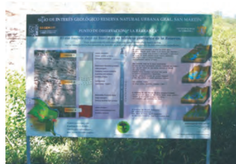
Figura 12 – Paneles temáticos instalados en el marco del proyecto Sitios de Interés Geológico del SEGEMAR. Reserva Natural Urbana Geral. San Martín, provincia de Córdoba.