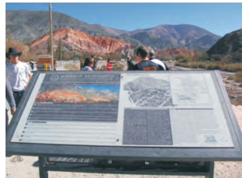
Figura 19 – El primer mirador geológico de Jujuy fue habilitado en la localidad de Purmamarca, con vista al Cerro Siete Colores.