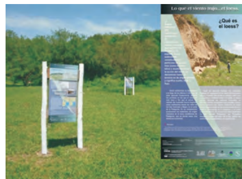
Figura 14 – Paneles temáticos instalados en el marco del proyecto Sitios de Interés Geológico del SEGEMAR. Reserva Natural Urbana Parque del Este, provincia de Buenos Aires.