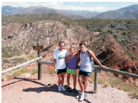
Figura 6 – Panorama desde el Mirador Geológico de la Reserva Natural Divisadero Largo.

nombre hace referencia al Cerro Divisadero, desde el cual los nativos avistaban el tránsito de las manadas de guanacos y otros animales para darles cacería. Más allá de la belleza natural del área, se destaca en la Reserva una evidente falla geológica cuyo desplazamiento ha permitido el afloramiento de diferentes niveles de rocas sedimentarias que representan un intervalo de tiempo mayor de 200 millones de años. El principal propósito de la creación de la Reserva lo constituye la protección del conjunto de afloramientos de rocas sedimentarias fosilíferas (Figura 6).