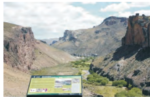
Figura 13 – Paneles temáticos instalados en el marco del proyecto Sitios de Interés Geológico del SEGEMAR. Monumento Histórico Nacional y Patrimonio de la Humanidad. Cueva de Las Manos, provincia de Santa Cruz.