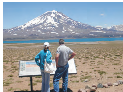
Figura 10 – El cartel, de 200 por 70 centímetros, consta de un texto principal en el que se describen los estadios evolutivos del centro eruptivo volcán Maipo – caldera del Diamante, textos secundarios vinculados al paisaje actual, historia eruptiva y peligrosidad, vistas panorámicas explicativas y fotografías de diferentes sectores del área, imagen satelital y texto resumido en inglés.

El éxito de esta primera prueba indujo a continuar con la tarea en otros lugares del país