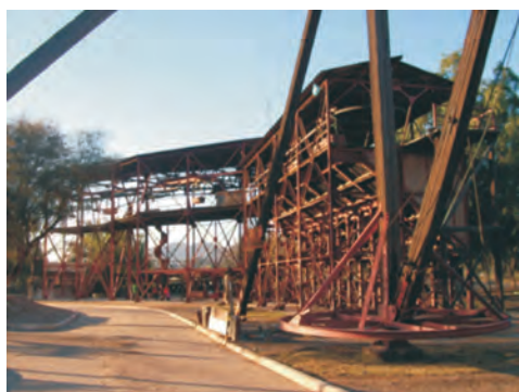
Figura 4 – Estación N° 1 del Cablecarril de la mina La Mejicana en Chilecito. Allí el museo "Dr. Santiago Bazán" exhibe maquinarias, herramientas y elementos diversos utilizados en la época de funcionamiento del cable.

Existen otros varios emprendimientos en los que el patrimonio minero es parte fundamental de la propuesta turística y del patrimonio del lugar, entre ellos Mina La Carolina, en la provincia de San Luis, el famoso cablecarril de la mina la Mejicana en la provincia de la Rioja (Figura 4) declarado Monumento Histórico Nacional por decreto N° 999 del 25/10/1982 (Marcos 2008) o las geodas de Minas de Wanda-Libertad, en la provincia de Misiones (Ávila et al. 2008) sólo para mencionar algunos.