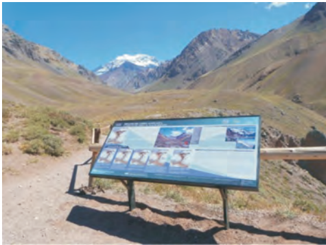
Figura 16 – Paneles temáticos instalados en el marco del proyecto Sitios de Interés Geológico del SEGEMAR. Parque Provincial Aconcagua, provincia de Mendoza.

Durante el año 2012 otras acciones relacionadas con paneles temáticos -desde otros organismos- fueron la puesta en valor del patrimonio paisajístico y la implementación de miradores interpretativos en la provincia de Jujuy. Esto fue llevado a cabo a través de un Programa Nacional de Inversiones Turísticas y de Señalización Turística de la Provincia de Jujuy, encarado por la Secretaría de Turismo y Cultura de la provincia con el apoyo del Ministerio de Turismo de La Nación. Los miradores y los paneles (Figura 19) brindan información sobre paisajes icónicos de la provincia y muestran en muchos casos una breve descripción de las formaciones geológicas, con textos en idioma español, inglés y portugués. Están ubicados a la vera de rutas nacionales y provinciales. Entre los puntos seleccionados se encuentran las Salinas Grandes, la Cuesta de Lipán, la Paleta del Pintor, las Huellas de Dinosaurios, las Termas de Reyes, el Dique La Ciénaga, la Laguna Desaguadero (en Yala) y el Parque Nacional Calilegua.