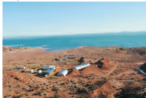
Figura 7 – El Centro se encuentra enmarcado por un paisaje natural en el que se desarrollan actividades educativas y culturales para todos los grupos que visitan el sitio, para todos los niveles, incluso el universitario. Se muestran todas las etapas en el rescate de restos de dinosaurios, desde la extracción hasta su estudio científico final y puesta en exhibición de las piezas rescatadas.

También cabe destacar acciones tendientes a la preservación del patrimonio a través de la interacción entre el Estado y la actividad privada. Un ejemplo de ello es el de la protección y puesta en valor turístico del Bosque Petrificado “Florentino Ameghino” bajo la figura jurídica de Custodio Rural (Lech & Reinoso 2008, Reinoso & Lech 2010). Esta área situada en el valle inferior del Río Chubut, departamento Gaiman, provincia del Chubut, es un recurso natural no renovable y al mismo tiempo un objeto del patrimonio cultural-paleontológico. La experiencia en esta área concilia actividades científico-académicas, de protección patrimonial, empresarial-turística privada, junto a un programa de actividades educativas. El plan de manejo contempla aporte científico, desarrollo turístico, inversión empresarial privada en infraestructura y servicios y, sobre todo, la coordinación y contralor del Estado como el responsable primario de la preservación del patrimonio. El Bosque Petrificado “Florentino Ameghino” (Figura 8) se encuentra en un terreno privado, con los derechos inalienables que ello conlleva; no obstante el dominio de ese elemento patrimonial es exclusivo del Estado Provincial.