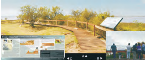
Figura 15 – Paneles temáticos instalados en el marco del proyecto Sitios de Interés Geológico del SEGEMAR. Reserva Natural Vuelta de Obligado, provincia de Buenos Aires.