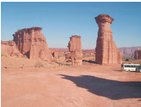
Figura 3 – El Parque Nacional Talampaya, en el sudoeste de la provincia de La Rioja, es una extraordinaria reserva paleontológica y uno de los pocos yacimientos en el mundo que contiene un interesante y completo registro de vertebrados fósiles que permite explicar su evolución y el desarrollo de la vida en la región durante todo el período Triásico. Tal contenido, junto a un interesante conjunto de geoformas de inconmensurable belleza lo posicionó como Patrimonio Natural de la Humanidad de UNESCO (Caselli 2008) (Fotografía por Fernando Miranda).

En ocasión de esa reunión también tuvo lugar el I Simposio de Patrimonio Geológico y Aspectos Geológicos y Ambientales de la Espeleología. Los trabajos allí presentados abordaron diferentes temas. Entre ellos: el inventario y caracterización de 28 puntos de interés geológico del territorio de la provincia de Córdoba -junto a propuestas para su aprovechamiento y su protección- (Leynaud 2002); una propuesta de valoración turística recreativa de recursos geológicos, paleontológicos y paisajísticos en la ciudad de Neuquén para el proyecto (no concretado) Monumento Natural Parque de los Dinosaurios (Vejsbjerg et al. 2002); el relevamiento de áreas de valor científico, cultural y estético en riesgo ante la realización de obras de infraestructura en la localidad de Nogolí, provincia de San Luis (Lacreu et al. 2002) y el análisis de la potencialidad y posibilidades de desarrollo de los georecursos del Parque Nacional Talampaya (Caselli 2002) (Figura 3).