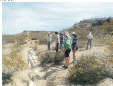
Figura 8 – El Bosque petrificado “Florentino Ameghino” es el primer Custodio Rural de la Provincia del Chubut y único en la República. El Bosque forma parte de la Formación Salamanca, y los troncos petrificados corresponderían a árboles que formaban parte de un extenso bosque de lauráceas y fagáceas que existió hace 60 millones de años.

También cabe destacar acciones tendientes a la preservación del patrimonio a través de la interacción entre el Estado y la actividad privada. Un ejemplo de ello es el de la protección y puesta en valor turístico del Bosque Petrificado “Florentino Ameghino” bajo la figura jurídica de Custodio Rural (Lech & Reinoso 2008, Reinoso & Lech 2010). Esta área situada en el valle inferior del Río Chubut, departamento Gaiman, provincia del Chubut, es un recurso natural no renovable y al mismo tiempo un objeto del patrimonio cultural-paleontológico. La experiencia en esta área concilia actividades científico-académicas, de protección patrimonial, empresarial-turística privada, junto a un programa de actividades educativas. El plan de manejo contempla aporte científico, desarrollo turístico, inversión empresarial privada en infraestructura y servicios y, sobre todo, la coordinación y contralor del Estado como el responsable primario de la preservación del patrimonio. El Bosque Petrificado “Florentino Ameghino” (Figura 8) se encuentra en un terreno privado, con los derechos inalienables que ello conlleva; no obstante el dominio de ese elemento patrimonial es exclusivo del Estado Provincial.