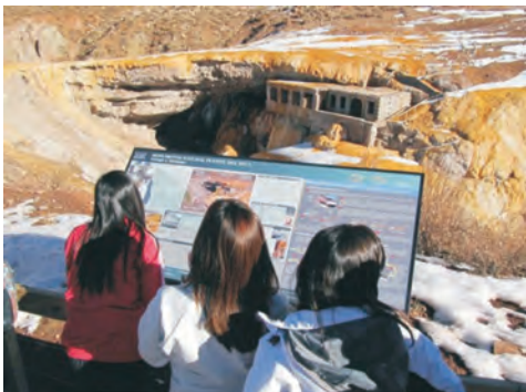
Figura 17 – Paneles temáticos instalados en el marco del proyecto Sitios de Interés Geológico del SEGEMAR. Puente del Inca, provincia de Mendoza.

Durante el año 2012 otras acciones relacionadas con paneles temáticos -desde otros organismos- fueron la puesta en valor del patrimonio paisajístico y la implementación de miradores interpretativos en la provincia de Jujuy. Esto fue llevado a cabo a través de un Programa Nacional de Inversiones Turísticas y de Señalización Turística de la Provincia de Jujuy, encarado por la Secretaría de Turismo y Cultura de la provincia con el apoyo del Ministerio de Turismo de La Nación. Los miradores y los paneles (Figura 19) brindan información sobre paisajes icónicos de la provincia y muestran en muchos casos una breve descripción de las formaciones geológicas, con textos en idioma español, inglés y portugués. Están ubicados a la vera de rutas nacionales y provinciales. Entre los puntos seleccionados se encuentran las Salinas Grandes, la Cuesta de Lipán, la Paleta del Pintor, las Huellas de Dinosaurios, las Termas de Reyes, el Dique La Ciénaga, la Laguna Desaguadero (en Yala) y el Parque Nacional Calilegua.