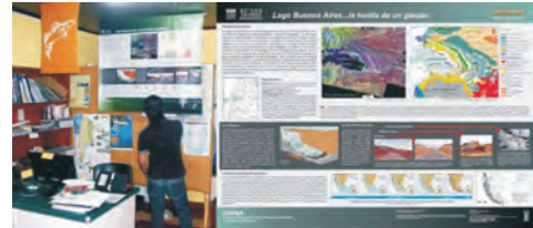
Figura 18 – Paneles temáticos instalados en el marco del proyecto Sitios de Interés Geológico del SEGEMAR. Los Antiguos, provincia de Santa Cruz.