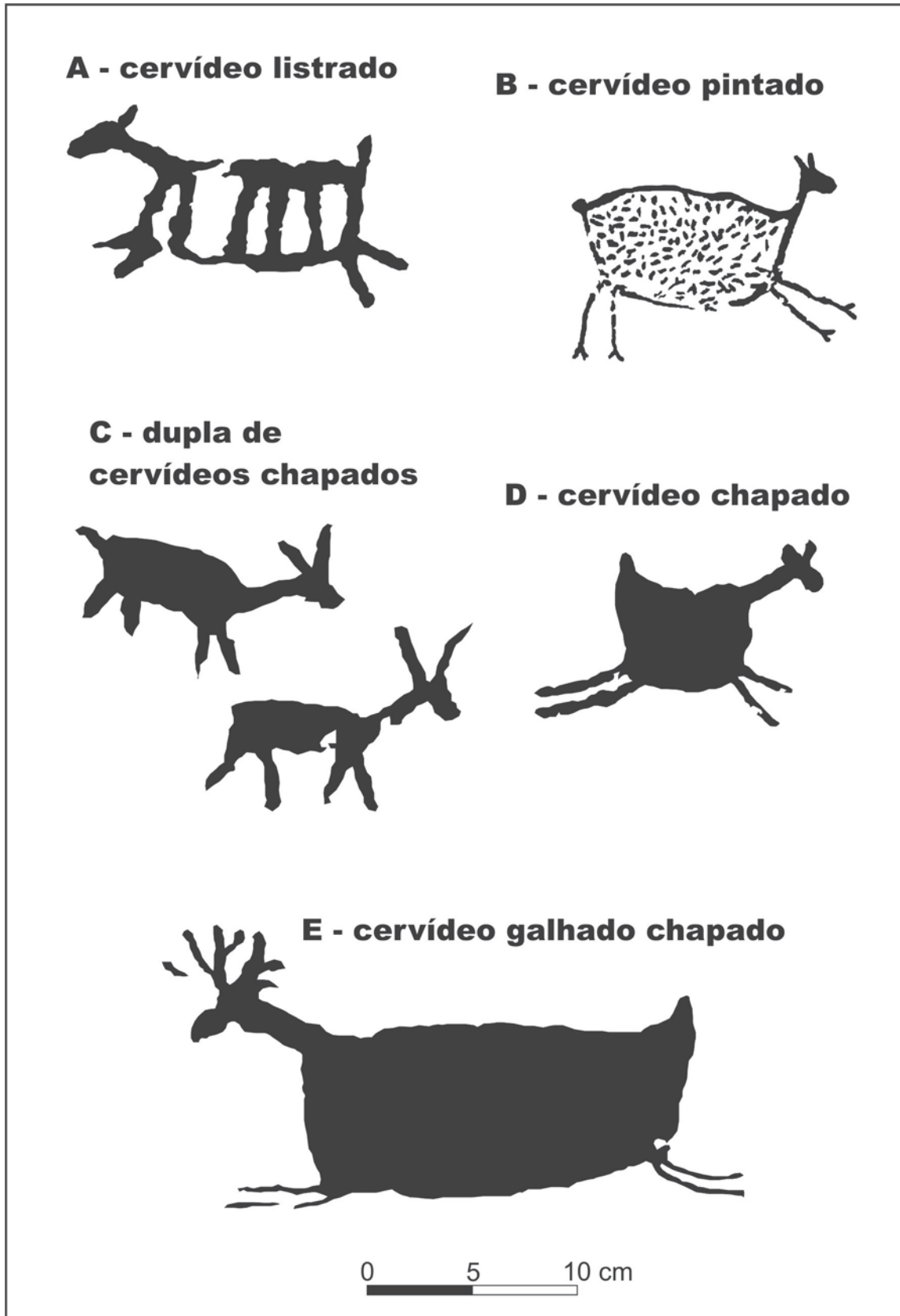
Figura 3 - Decalques das pinturas rupestres mais representativas do abrigo sob rocha no Sumidouro do Rio Quebra-Perna, Ponta Grossa, PR.